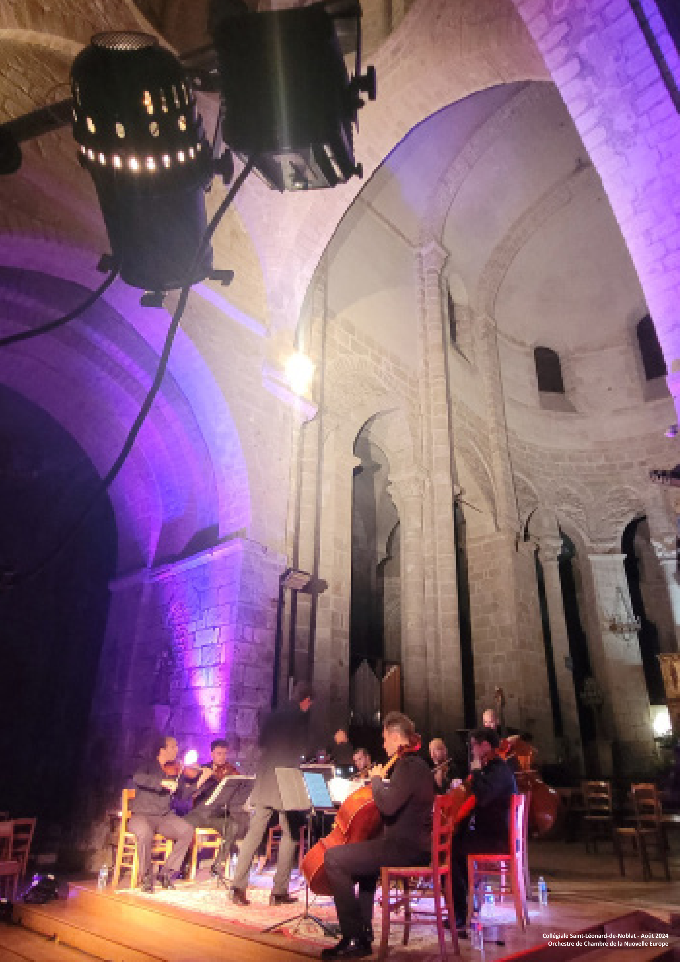
Collégiale Saint-Léonard-de-Noblat - Août 2024 Orchestre de Chambre de la Nouvelle Europe